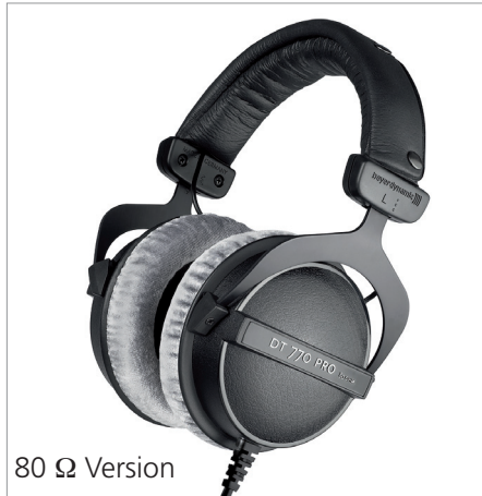
80 \Omega Version