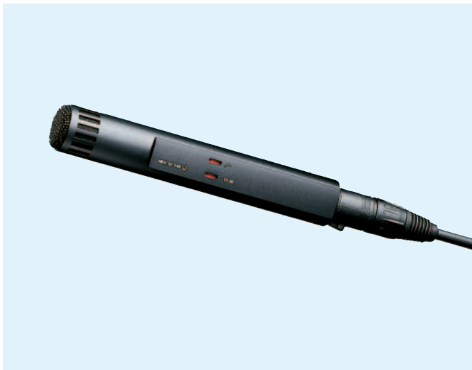
Das abgebildete Kabel gehört nicht zum Lieferumfang.

Das Supernierenmikrofon MKH 50 bietet eine hohe Diffus-schall- und Seitendämpfung als die Niere. Es wird vorzugsweise als Solisten- und Stützmikrofon bei hohen Anforderungen an seitliche Ausblendung und Rückkopplungssicherheit eingesetzt. Die frequenzunabhängige Richtcharakteristik ermöglicht eine stärkere Stützung ohne Einfluß auf die klangliche Balance.